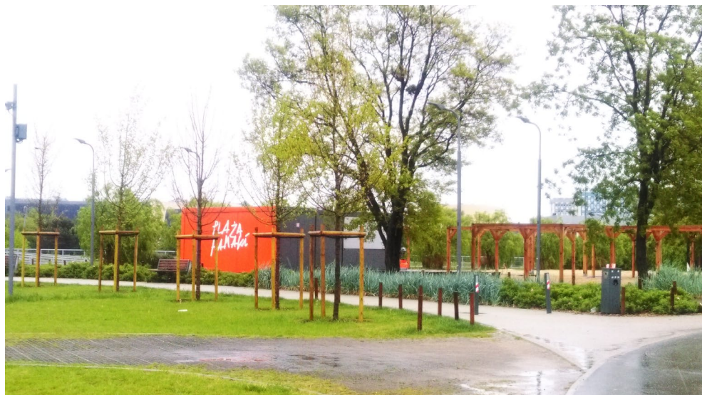
Ilustracje 3, 4. Widok na plażę miejską stanowiącą część nowego parku na Chwaliszewie w południowej części Starego Koryta Warty w Poznaniu