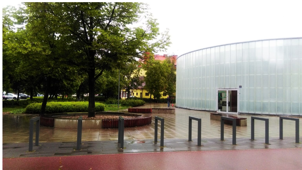
Ilustracje 1, 2. Pawilon „Nowa Gazownia” o charakterze centrum kultury i sztuki w południowej części Starego Koryta Warty na Chwaliszewie w Poznaniu