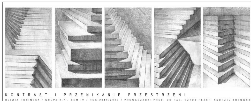
Rys. 1. Oliwia Rosińska, kierunek: architektura, studia I stopnia, semestr 4