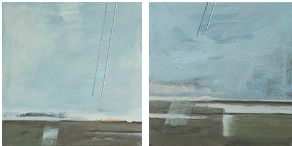
Rys. 3-4. To tam, W trakcie rozmowy , akryl, 40 cm × 40 cm; niejednorodny charakter przestrzeni tożsamej, na którą składa się kilka lub kilkanaście wątków budujących jej charakter, a odzwierciedlających charakter osoby z nią związanej, umożliwia nieograniczoną liczbę komentarzy, prowokując wzajemne oddziaływanie pomiędzy architekturą i obrazem; nasycenie emocjonalnymi związkami w autonomicznych pracach malarskich rejestrujących tożsame przestrzenie to rodzaj pamiętnika, który w ciągu lat zapisywania przybiera różnorodne barwy.

Wzajemne przenikanie się obu dyscyplin, sztuk projektowych i sztuk plastycznych, prowokuje zwrotne działania mające niebagatelny wpływ na aranżowanie przestrzeni adekwatnej do potrzeb konkretnego użytkownika. W odpowiedzi na klasyfikację przestrzeni procesy percepcji, wyodrębniając jej charakter, obrazują poziom akceptacji przez uaktywnianie bodźców zewnętrznych oraz wewnętrznych (neurocepcja i interocepca). Wskazują przez zachodzące w układzie nerwowym człowieka reakcje m.in., czy dana przestrzeń jest dla nas przyjazna, bezpieczna, niebezpieczna itd., stąd wspomaganie kroków aranżacyjnych zindywidualizowaną kreacją plastycznych form wyrażających autentyczność podejścia do problemu, a mających przełożenie na kształt danego wnętrza architektonicznego pogłębiać będzie wrażliwość, tożsamość jednostki i pobudzać aktywność w obszarach dbałości o kontekst zewnętrzny.