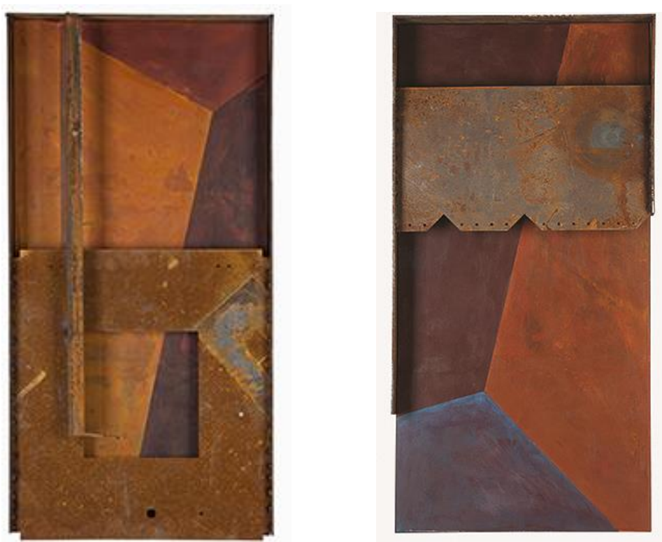
Rys. 1-2. Wartość podwójna, Życie , akryl, stal, 130 cm × 60 cm; klasyfikacja przestrzeni na podstawie obrazów interpretujących; przestrzeń toksyczna – interpretacja wewnątrz Muzeum Żydowskiego Daniela Libeskinda. Wykorzystane w konstruowaniu obrazów zardzewiałe elementy stali, pozyskane ze skupów złomu, wyrwane zgniatarki, a jeszcze do niedawna funkcjonujące w maszynie swego przeznaczenia, nadają im drugie życie, życie odzyskane, uratowane, podarowane. Zagłada tysięcy istnień ludzkich, dla nas w tej chwili niewyobrażalna, nazywająca się historią, łagodnieje w obrazach przedstawiających. Budowanie warunków pobudzających naszą wyobraźnię jednocześnie ją pogłębia, uzmysławiając głębię treści.

oraz dbałość o wspólne środowisko napędza i potęguje efekt sumowania się zależności wynikających z poczucia tożsamości oraz odpowiedzialności za grupę i miejsce. Złożona tożsamość umacnia zjawisko więzi społecznych, poprawia stosunki społeczne, sprzyjając rozwojowi w atmosferze poszanowania oraz troski o stan obecny, jak i przyszły naszego miejsca pracy, wypoczynku czy innych aktywności.