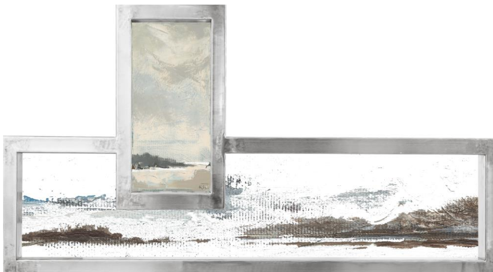
Rys. 6. Obraz, przestrzenna forma użytkowa / obraz-półka z propozycją aranżacji kompozycji dostosowaną do potrzeb użytkownika danej przestrzeni