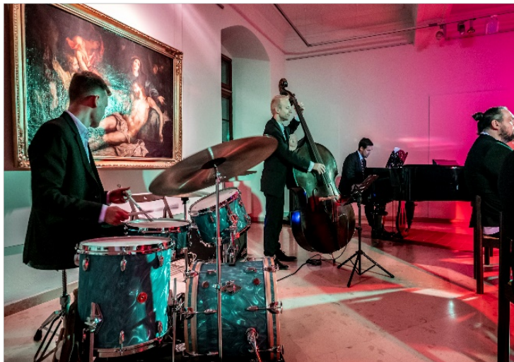
Rys. 8. Zaduszki Jazzowe, 2021 r.

nagrody Divinis et Humanis , przyznawanej przez Fundację współczesnym „ludziom renesansu”. Założenie Instytutu poprzedziło powstanie Wydawnictwa Akademii Lubrańskiego publikującego prace istotne dla nauki, kultury, twórczości artystycznej, literackiej i myśli chrześcijańskiej. W bieżącym roku ukazały się m.in. Bóg niepodobny do Boga. Pasja Chrystusa w sztuce i słowie oraz Extra muros Posnaniae. Kościół św. Jana Jerozolimskiego za Murami w Poznaniu .