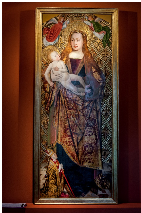
Rys. 2. Madonna z Dzieciątkiem i fundatorem – biskupem Janem Lubrańskim, ok. 1520 r. [Muzeum Narodowe w Warszawie]

dzenia intelektualnego, rozkwitu samorządu, współpracy wszystkich stanów, higieny i porządku. W renesansie odnajdziemy religijne i społeczne wojny, rozpaczliwe zwątpienie w ludzkie możliwości, pogardę dla słabszych i pochwałę politycznej przemocy, brud i zabobon. Równie dobrze jednak te charakterystyki można zamienić”. Tak, potoczny ogląd średniowiecza i renesansu często gubi się w uproszczeniach i stereotypach niezgodnych z historycznymi realiami, bo ówczesna rzeczywistość była bardziej różnorodna, dynamiczna i wielowymiarowa. Zanurzona w tym pograniczu dwóch epok postać Jana Lubrańskiego wymyka się prostym ocenom i schematom, lecz niewątpliwie opowiada niezwykle bogate i harmonijne świadectwo zaangażowania, kreatywności i zatroskania o sprawy boskie i ludzkie – divina et humana .