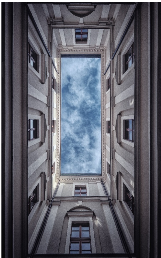
Rys. 11. Widok elewacji wewnętrznej dziedzińca z dołu

Założenia architektoniczne dotyczące lokalizacji i proporcji szklanego dachu zaprojektowano, opierając się na elementarnych zasadach kompozycji. Głównym za-