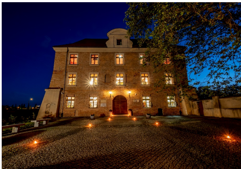
Rys. 10. Elewacja frontowa oświetlona iluminacją

Przeciwagą dla strony południowej są zlokalizowane po stronie północnej Ogrody Lubrańskiego – to najnowszy znajdujący się w fazie realizacji projekt Fundacji. Oczywiście jest to także ważne miejsce dla wszystkich zwiedzających, tak dla Poznaniaków, jak i dla turystów: miejsce wypoczynku, ale i spotkania ze sztuką, miejsce koncertów, warsztatów, rodzinnych sesji fotograficznych oraz wielu innych aktywności. W Ogrodach powstała naziemna instalacja fotowoltaiczna wytwarzająca energię na potrzeby Akademii. Fundacja, idąc w ślady swojego patrona, planuje również spektakularne, nowoczesne i proekologiczne założenia architektoniczne, które na trwałe wpiszą się w krajobraz Ostrowa Tumskiego i otworzą tę przestrzeń na wydarzenia kulturalne, historyczne, edukacyjne.