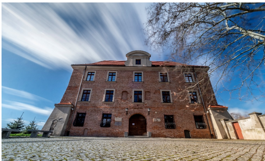
Rys. 3. Elewacja frontowa Akademii Lubrańskiego