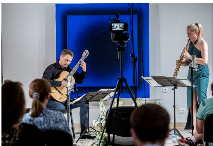
Rys. 9. Festiwal Muzyczny „Duetomania”, 2021 r.