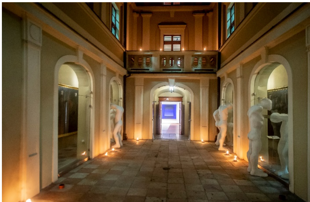
Rys. 6. Dziedziniec Akademii: Lamentacje Grzegorza Niemyjskiego