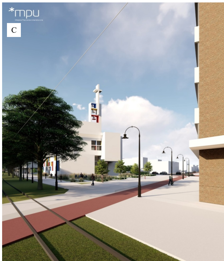
Rys. 3. Kościół w dzielnicy Wolne Tory – wizualizacja sporządzona przez Miejską Pracownię Urbanistyczną do Miejsowego planu zagospodarowania przestrzennego „Wolne Tory” w Poznaniu (A, B, C) [Miejska Pracownia Urbanistyczna w Poznaniu]

projektu na tle wniosków z badań, w których jako jeden z głównych problemów posoborowej architektury sakralnej w Poznaniu wskazano przypadkowość usytuowania. W latach minionych, szczególnie przed 1990 r., ze względu na ówczesne uwarunkowania polityczne powszechne było lokalizowanie kościołów w miejscach przypadkowych, wynikających jedynie z dostępności możliwej do pozyskania działki. Co więcej, forma architektoniczna wielu tamtych zamierzeń abstrahowała często od otaczającego kontekstu, podążając głównie za aktualnymi trendami lub modą. Zaproponowana forma kościoła na Wolnych Torach również pod tym względem odpowiada na problem wskazany w badaniach – jest adekwatna do stylistyki sąsiedniej zabudowy zaprezentowanej w wizji dzielnicy, a całość dopełnia współgrająca z nią geometryczna kompozycja placu przed kościołem oparta na kolejnych podziałach prostokątów.