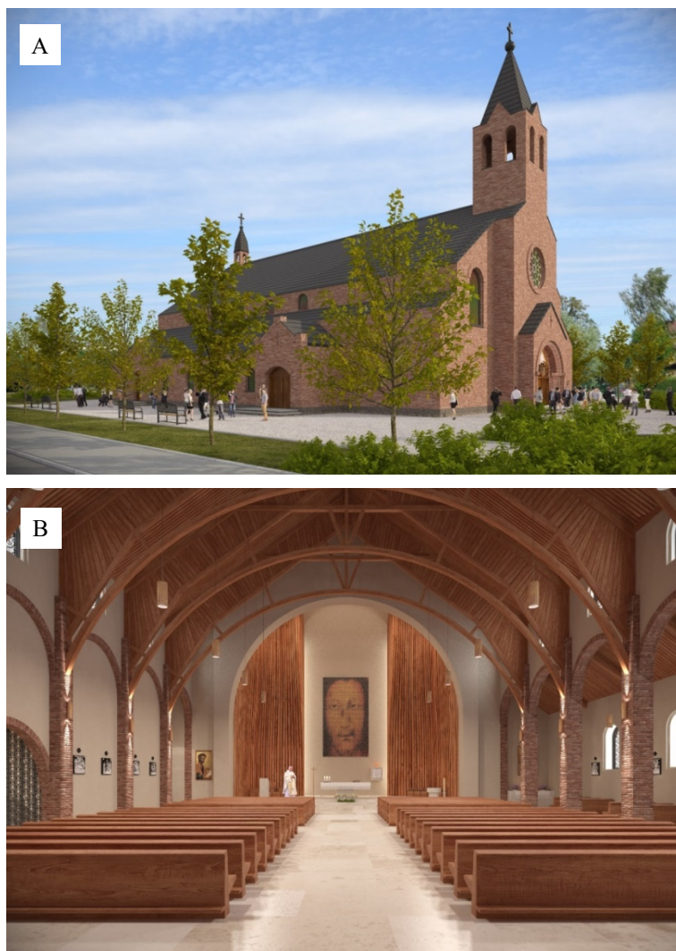
Rys. 4. Wizualizacja nowego kościoła na Sławiu – elewacja (A), wnętrze (B); proj. mgr inż. arch. Ewa Wiśniewska [materiały projektantki]

Koncepcja nowego kościoła pw. św. Andrzeja Apostoła na Sławiu powstała jako odpowiedź na potrzeby związane z rosnącą liczbą mieszkańców tej dzielnicy. Istniejący zabytkowy kościół pw. św. Andrzeja Apostoła, zbudowany w XV w. w stylu gotyckim (na miejscu wcześniejszej świątyni z XIV w.), następnie odbudowany po potopie szwedzkim, przebudowany w XIX w. w stylu neogotyckim