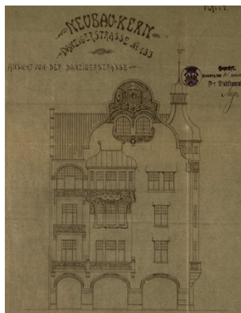
Rys. 3. Bydgoszcz, al. Mickiewicza 1, projekt elewacji z detalem (obecnie nieistniejącym) [APB 4233]

Istotną część kamienicy, jej swoistą wizytówkę, stanowiła fasada budynku. Na przełomie XIX i XX stulecia na tym polu panował pluralizm stylowy. Chcąc odejść od panującego w XIX w. historyzmu, architekci stosowali różne formy. W tamtym czasie w Bydgoszczy adaptowano rozwiązania stylistyczne używane przez berlińskich architektów. Jednym z propagatorów tych nowinek był Rudolf Kern. Architekt chętnie stosował skromne cechy Jugendstil, czego świetnym przykładem jest kamienica będąca niegdyś jego własnością (przy al. Adama Mickiewicza 1) 5 . W bardziej kameralnych realizacjach używał stylu Landhaus czy tzw. „uproszczonego” historyzmu, o eleganckich formach wystylizowanego detalu, lansowanych w Berlinie przez Alfreda Messela czy Alberta Gessnera [Posener 1979: 344-346; 321-331]. Nieobce były mu również realizacje w duchu malowniczego historyzmu.