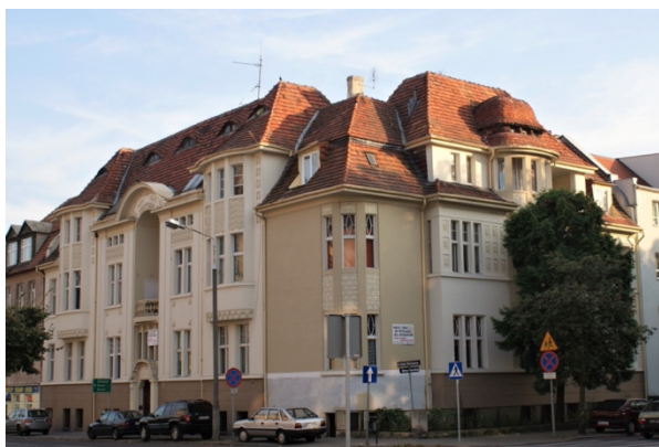
Rys. 5. Bydgoszcz, al. Adama Mickiewicza 4

Dom dochodowy przy al. Adama Mickiewicza 4 (róg ulicy Ignacego Paderewskiego) to kolejny przykład budowli o skromnych, ale eleganckich detalach w duchu secesji, i oryginalnych formach okien, zachowanych do dziś. Poprzez wzbogacenie bryły tego potężnego narożnego budynku wieloma wykuszami i loggiami, zróżnicowanie wysokości poszczególnych partii i przykrycie wielospadowymi, łamanymi dachami architekt zyskał pełną ekspresji i światłocienia kompozycję. Całość dopełniają zgeometryzowane sztukaterie, różnorodnie rozmieszczone w przestrzeniach pod- i międzyokiennych.