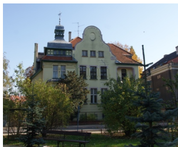
Rys. 6. Bydgoszcz, ul. Ignacego Paderewskiego 4

nymi w Berlinie) 7 . Bryłę budynku stanowi kilka przenikających się sześcianów nakrytych osobnymi dachami o różnych formach. Całość urozmaicono wysokimi szczytami (pierwotnie z dekoracją sztukatorską), formą wieży i wieloma innymi elementami architektonicznymi. Od strony ogrodu wprowadzono ponadto elementy w konstrukcji szkieletowej. Architekt podkreślił okna i wykusze wysmakowaną dekoracją wykorzystującą motywy florystyczne, kobiece głowy z długimi włosami, pszczoły itp. Schody prowadzące z tarasu do ogrodu ozdobiono stylizowanymi głowami ryb. Willa miała luksusowe, funkcjonalnie rozplanowane wnętrza. Głównym pomieszczeniem parteru była jadalnia skomunikowana z tarasem prowadzącym do ogrodu. Od frontu umieszczono salon, gabinet pana domu i dodatkowy pokój. Przy jadalni mieściła się kuchnia ze spiżarnią z osobnym wejściem i schodami do piwnicy. Na piętrze usytuowano sypialnię, pokój gościnny, służbówkę, toaletę i łazienkę.