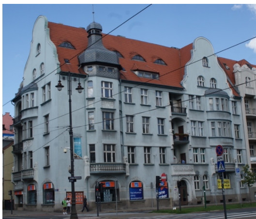
Rys. 4. Bydgoszcz, al. Mickiewicza 1