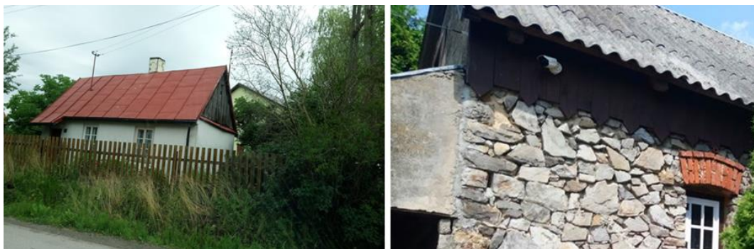
Rys. 2. Budownictwo murowane: 1. Chałupa z Świętej Katarzyny, 2021 (A) [fot. M. Purski]; Chałupa z Mąchocic, 2021 [fot. M. Purski]

(dziedzińca gospodarczego). Przed budynkiem mieszkalnym znajdował się ogródek oraz rów melioracyjny.