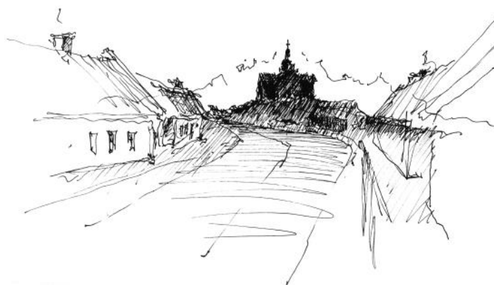
Rys. 1. Sylweta wsi Bieliny z dominantą w postaci kościoła pw. św. Józefa – Oblubieńca Najświętszej Maryi Panny, Bieliny [szkic autora]

Urządzenie wsi zakładało parcelację gruntów, zgodnie z którą zagrody lokowane były prostopadle do drogi, najczęściej po jej północnej stronie. Taka decyzja przełożyła się również na układ przestrzenny samej zagrody. Każda zagroda składała się z budynku mieszkalnego ulokowanego od strony dłuższego boku w stronę drogi (z oknami na południe) oraz budynków gospodarczych skupionych wokół majdanu