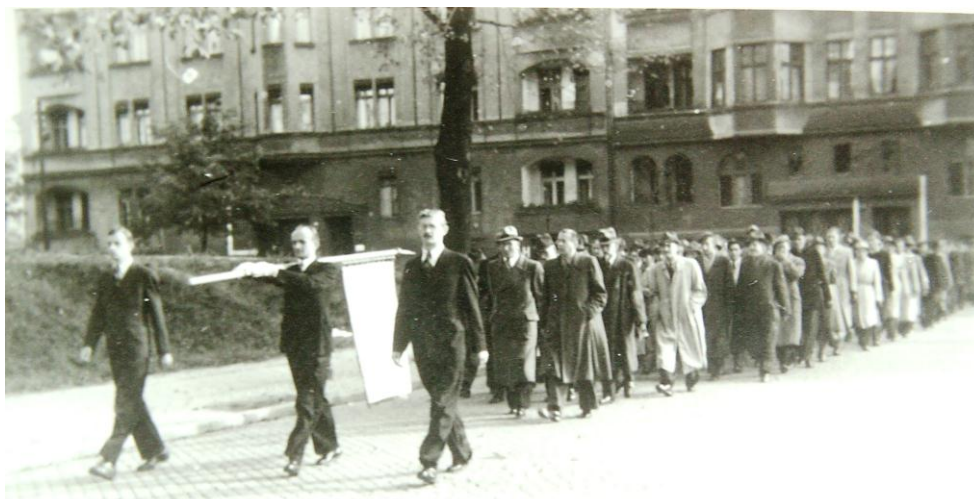
Rys. 3. Inauguracja roku akademickiego 1945/1946 w Szkole Inżynierskiej w Poznaniu, 30 września 1945 r.