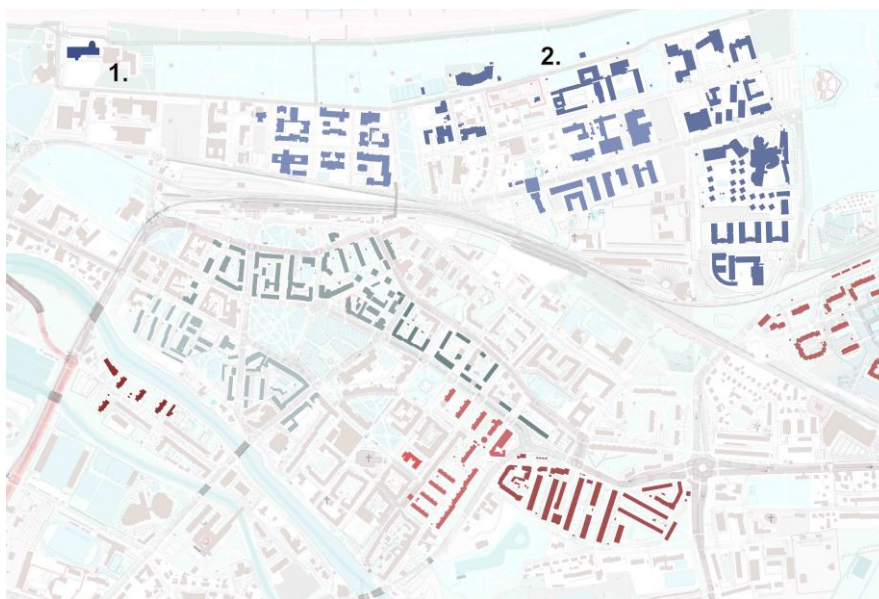
Rys. 4. Rozwój uzdrowiska [na podstawie Openstreetmap] 1. Hotel Bałtyk; 2. Obszar zajmowany przez zakłady

Bazę sanatoryjno-wypoczynkową znacząco wzbogaciły ośrodki budowane przez zakłady z całej Polski, m.in. Poznańskie Zakłady Budownictwa Przemysłowego, Spółem, Częstochowskie Zakłady Materiałów Ogniotrwałych. Budynki powstawały we wschodniej części dzielnicy uzdrowskiej i rozrastały się aż do parku im. Aleksandra Fredry [Patan 2011: 144]. W 1964 r. wybudowano Ośrodek Sanatoryjno-Wypoczynkowy CRZZ Bałtyk zlokalizowany w miejscu istniejącego do 1945 r. pałacu nabrzeżnego Strandschloß, będącego jednym z najbardziej okazałych i reprezentacyjnych budynków w przedwojennym Kołobrzegu. Okazała, choć prosta, modernistyczna bryła budynku została wzbogacona o dynamiczną artykulację przeszkleń w fasadzie i wysunięty w stronę morza półokrągły pawilon. W 1966 r. uruchomione zostały nowe źródła solankowe, znacząco uatrakcyjniające ofertę sanatoriów. Intensywna odbudowa uzdrowiska trwała do początku lat 70. XX w., kiedy to oddano do użytku moło spacerowe. Doprowadziło to do przywrócenia centralnej części uzdrowiska dawnego reprezentacyjnego charakteru. Koncentracja usług uzdrowskich na tym obszarze wynikała z bliskości centrum, a jego ekspansję hamował kanał portowy na zachodzie i znajdujące się za nim niedostępne poligony wojskowe.