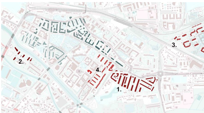
Rys. 3. Odbudowa tkanki miejskiej w latach 70. XX w. – nowe osiedla (na podstawie [Openstreetmap])

konkuresem organizowanym przez SARP. W rejonie dawnych murów obronnych wybudowano dwa jedenastopiętrowe bloki w formie „desek” oraz prostopadły do nich szpaler pięciokondygnacyjnych budynków [Kondziela 1998: 106].