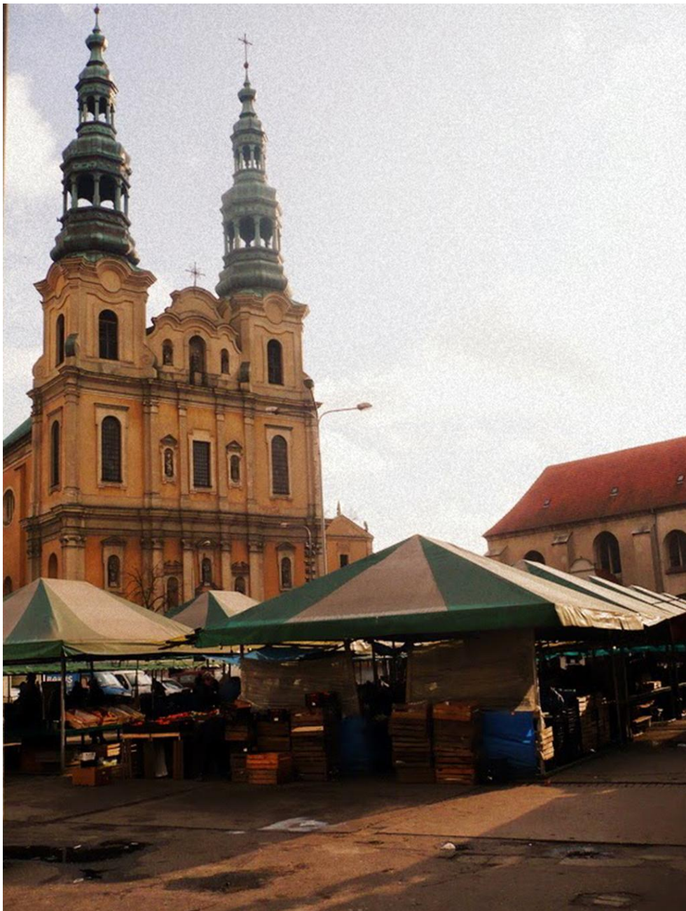
Rys. 8. Plac Bernardyński przed rewaloryzacją; widoczne stragany i zniszczona płyta kamienno-betonowa