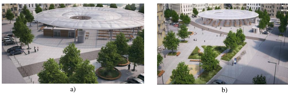
Rys. 3. Koncepcja zwycięskiego projektu na rewitalizację rynku Łazarskiego; a) wizualizacja fragmentu przestrzeni placu z widocznym projektem zadania projektowanego targowiska [Wielkopolska 2023a]; b) wizualizacja obrazująca targowisko oraz fragment „lejka” [Wielkopolska 2023b]

Uporządkowany został także ruch kołowy, który wyprowadzono na obrzeża rynku (zlikwidowano przejazd przez środek płyty rynku). Na prośbę użytkowników i mieszkańców bez zmian pozostawiono liczbę miejsc parkingowych (rys. 3a-3b).