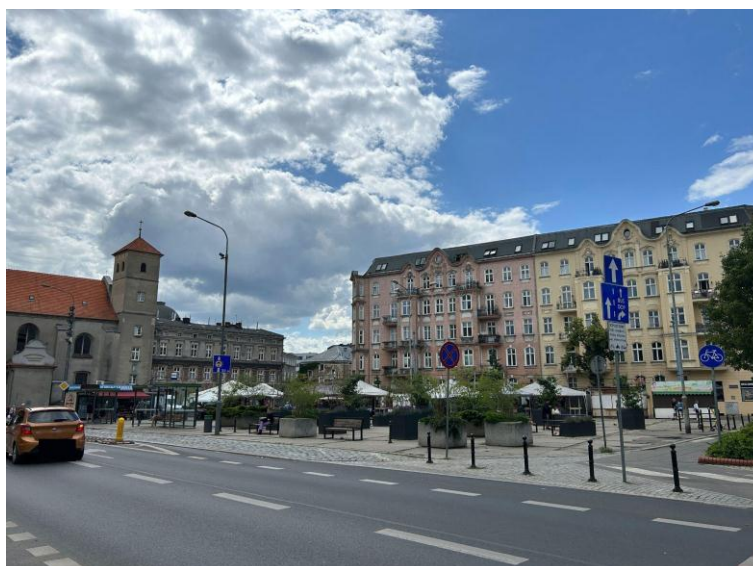
Rys. 10. Widok na Plac Bernardynów od strony ul. Garbary [fot. K. Słuchocka]

Rys. 9. Widok na Plac Bernardyński po zakończonych pracach rewitalizacyjnych; a) przestrzeń placu zabezpieczono donicami z zielenią usytuowanymi na nawierzchni wymagającej dalszych prac remontowych; b) plac w godzinach porannych nie przyciąga ludzi [fot. K. Słuchocka]