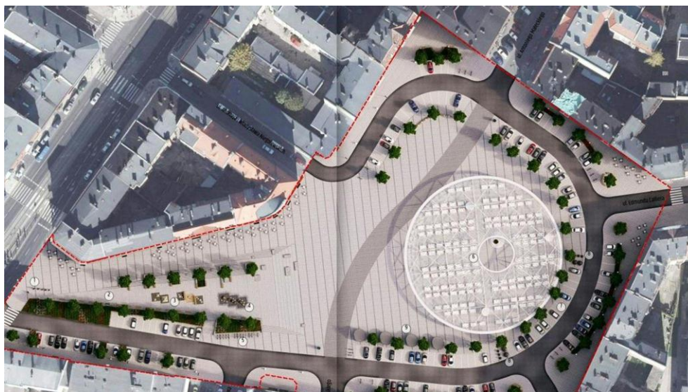
Rys. 2. Koncepcja rewaloryzacji rynku Łazarskiego w Poznaniu; proj. APA Jacek Bułat [Poznań 2023]

ponowano mieszkańcom Łazarza całkowicie nową formułę, wyróżniającą się wyrazistą okrągłą formą zadania targowiska, uzupełnioną o tzw. część rekreacyjno-wypoczynkową z placem zabaw oraz miejscem na ogródki gastronomiczne.