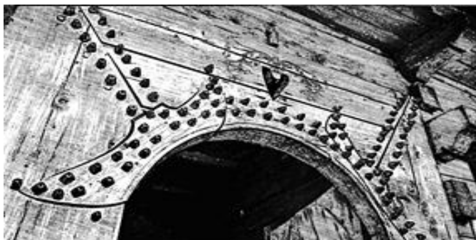
Rys. 5. Górna część futryny, ozdobiona kołkami, ułożonymi we wzory na psach i łączeniu desek. Zakopane, 2019 [N. Maksymowicz Mróz]

Bezpieczeństwo domownikom zapewniło specyficzne zastosowanie formy i konstrukcji drzwi. Kwestię zawiasów Górale rozwiązyali poprzez wbudowanie w drzwi słupa, który był połączony konstrukcyjnie z elementami poziomymi. Zarówno drzwi wewnętrzne, jak i zewnętrzne zawsze otwierały się do wewnątrz. Zabezpieczało to dom przed włamaniem, gdyż drzwi nie można było wyważyć od zewnątrz [Białas 1991]. Ilość kołków w drzwiach była zróżnicowana, a materiałem, z którego je wykonano, było drewno jesionu [Matlakowski 1892]. Oczywiście jest, że ze względów konstrukcyjnych taka ilość kołków nie była potrzebna, ale Górale używali ich do ozdobienia drzwi.