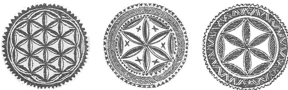
Rys. 3. Wzory rozet geometrycznych, umieszczanych na drzwiach, sosrębach, meblach i narzędziach [oprac. N. Maksymowicz Mróz na podstawie szkiców Matlakowskiego]

Rozeta otoczona promieniami, z powielonym motywem heksagonalnym jest popularnym wzorem umieszczanym na drzwiach od strony zewnętrznej. Charakterystyczne wgłębienia wykonane siekierą lub nożem „kozikiem” dają wrażenie trójwymiarowości.