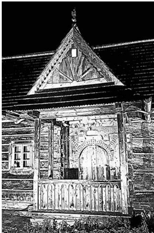
Rys. 2. Wejście do chałupy podhalańskiej Gąsieniców-Sobczaków. Droga Do Rojów 6, Zakopane, 2019 [fot. i stylizacja N. Maksymowicz Mróz]

W zależności od warunków atmosferycznych i zmieniających się pór roku drewniany budynek kurczy się lub rozszerza nawet o kilkanaście centymetrów (pomiar w kalenicy budynku parterowego). Aby odrzwia oraz okna w postaci słupów wiązanych nie wypadły ze ściany, pozostawiano nad gniazdami fartuszki, inaczej uszy. Są to obłapy wykonane w płazie, w której znajduje się gniazdo na odrzwia lub okno. Kształt fartuszków jest tak dobrany, by mogły dobrze spełniać swoje zadanie. Elementy te dodatkowo podnoszą estetykę budynku [Białas 1991]. Podhalańskie drzwi mają również unikalny charakter: odrzwia wzmocnione są psami , a na skrzydle lub nad nim umieszczano kołki. Wzory i ilość kołków zależały od osobistych upodobań mieszkańców, czasem ich ilość dorównywała 62 sztukom [Białas 1991].