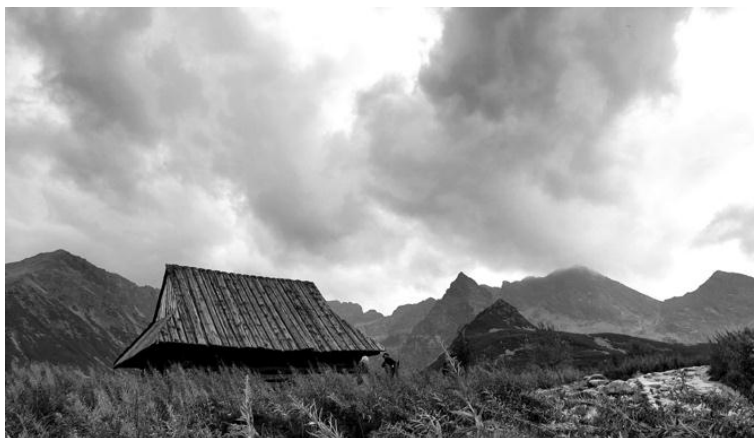
Rys. 1. Charakterystyczny krajobraz architektoniczny Podhala. Szalas pasterski wkomponowany w panoramę Tatr, Hala Gąsienicowa, 2019

budową domów stawianych frontową ścianą do południa, niezależnie od ukształtowania terenu czy sieci dróg. Pomimo takiej różnorodności domy góralskie dobrze komponowały się z otaczającym górskim krajobrazem.